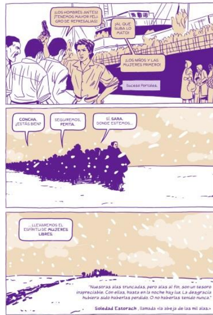
Ilustración: Román López Cabrera. Leyenda: Román López Cabrera y Soledad Estorach. Dibujos: Román López Cabrera.