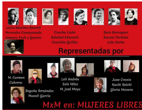
Cartel de la representación de "Escenas libertarias"